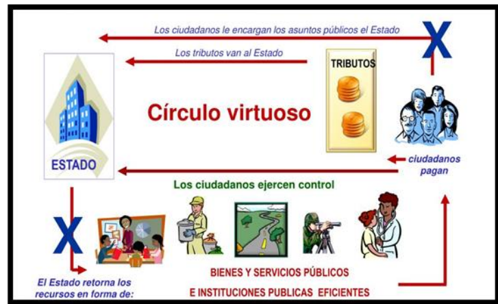
Figura 1. Circulo virtuoso

De la búsqueda bibliográfica referente a la importancia de la recaudación de impuestos sobre los nuevos parques de la ciudad de Portoviejo, se logró constatar la veracidad de nuestra hipótesis “contribuir al Estado es un compromiso y una obligación ciudadana ya que con el pago de impuestos en dinero, especies o servicios se financian las demandas y necesidades de la población”; prueba de ello es lo que mencionan diversos autores, gracias a la contribución de los impuestos de las personas que viven en la ciudad de Portoviejo, y sobre todo en el sector de estos nuevos parques, el GAD Portoviejo ayudo a beneficiar a la comunidad en general, ya que financió la construcción de los nuevos parques entre ellos “La Rotonda”.